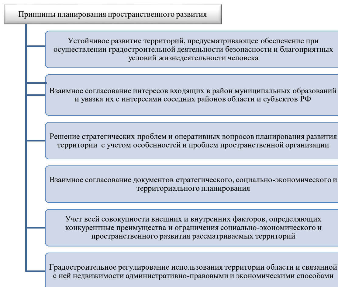
Рис. 1. Общепринятые принципы планирования пространственного развития

Принципы планирования пространственного развития территории. В соответствии с Градостроительным кодексом Российской Федерации под территориальным планированием понимается деятельность, направленная на определение в документах территориального планирования назначения территорий, исходя из социально-экономических, экологических и иных факторов, с целью комплексного устойчивого развития территории, формирования социальной, инженерной и транспортной инфраструктур, обеспечения учета интересов граждан и их объединений, Российской Федерации, субъектов Российской Федерации, муниципальных образований.