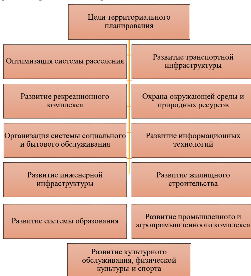
Рис. 2. Основные цели территориального планирования

Цели и задачи территориального планирования. Цель территориального планирования состоит в максимально эффективном использовании внутреннего потенциала городского поселения, для которого разрабатывается документ, и усилении его позиции среди других районов при одновременном существенном улучшении качества жизни проживающего в нем населения. Основные цели территориального планирования представлены на рис. 2.