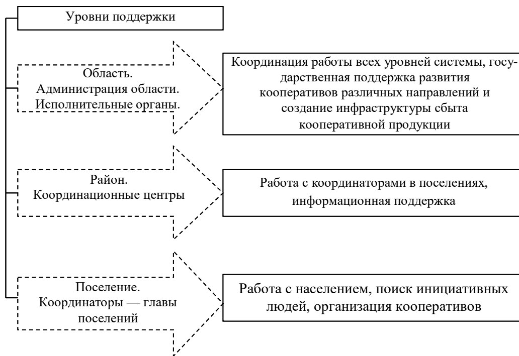
Рис. 3. Трехуровневая система управления развитием кооперации Липецкой области

Первостепенное внимание и максимум бюджетных средств направляются на создание кооперативов на районном и поселенческом уровнях, поскольку только здесь создаются основы сельскохозяйственной кооперации и кооперативного движения. В связи со слабым развитием в районах общественных формирований сельскохозяйственной кооперации, отсутствием у них квалифицированных и подготовленных кадров кооперации в каждом районе организованы координационные центры с непосредственным участием районных властей.