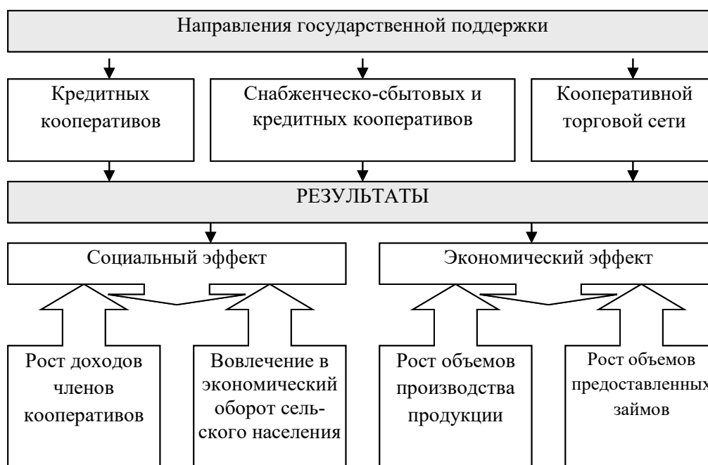
Рис. 2. Основные результаты программы «Развитие кооперации и коллективных форм собственности в Липецкой области на 2014–2020 годы»

Программа предусматривает меры государственной поддержки на всех этапах развития кооператива (от его создания до реализации произведенной продукции) и направлена на обеспечение занятости жителей села, устойчивое развитие сельских территорий и повышение уровня жизни на селе, причем сельскохозяйственным кооперативам предоставляются следующие субсидии: