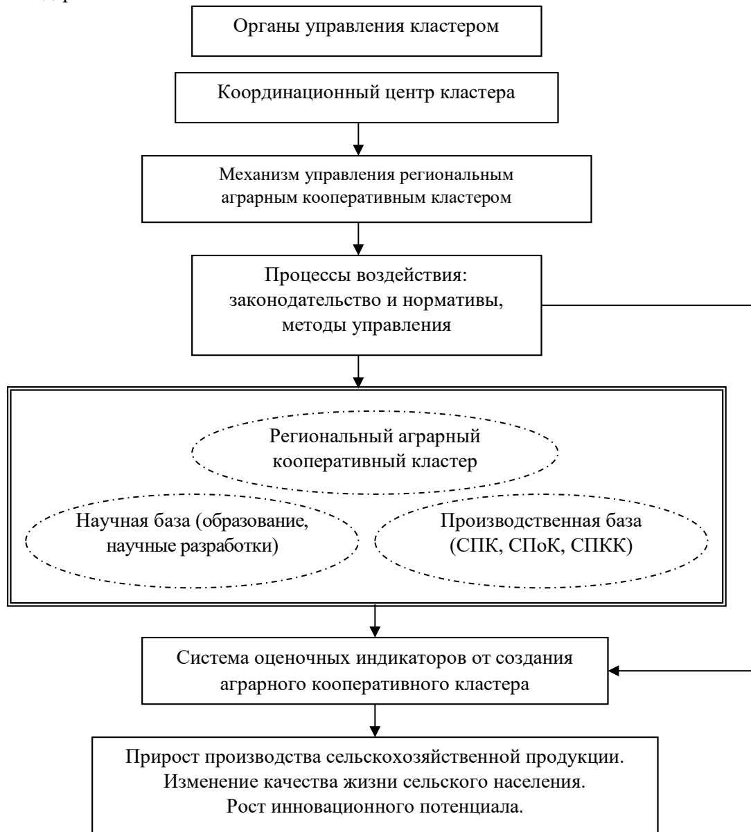
Рис. 5. Механизм управления аграрным кооперативным кластером (источник: [7])

По данным авторов, преимуществами аграрного кооперативного кластера является эффект охвата, который при объединении отдельных хозяйствующих структур в кластер существенно усиливается из-за возможности использования многофункциональных факторов при минимизации транзакционных издержек.